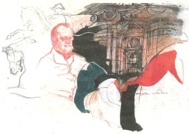
«Cavour» di Giacomo Soffiantino