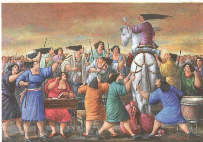
«Repubblica» di Rocco Forgione

Dal volto di Cavour al profilo di Dante Alighieri alla breccia di Porta Pia, un percorso carico di simboli, rimandi e ricordi